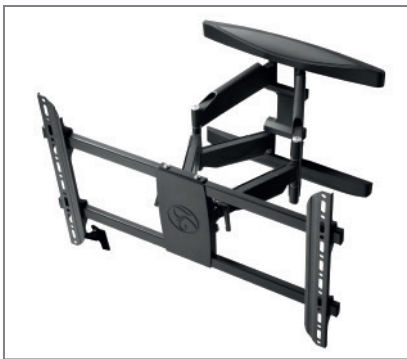
min. 60 bis max. 500 mm Wandabstand