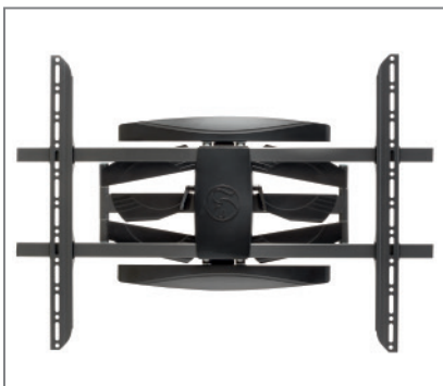
VESA-Aufnahme bis max. 800 x 600 mm