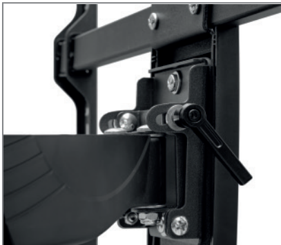
werkzeuglos justierbarer Neigungswinkel